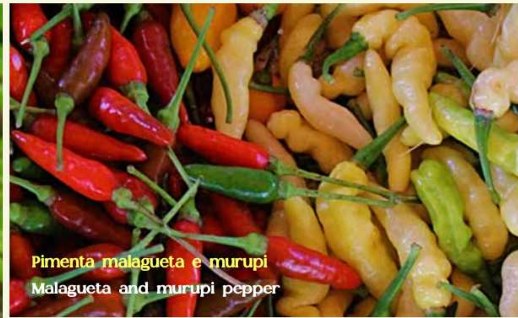
Pimenta malagueta e murupi Malagueta and murupi pepper