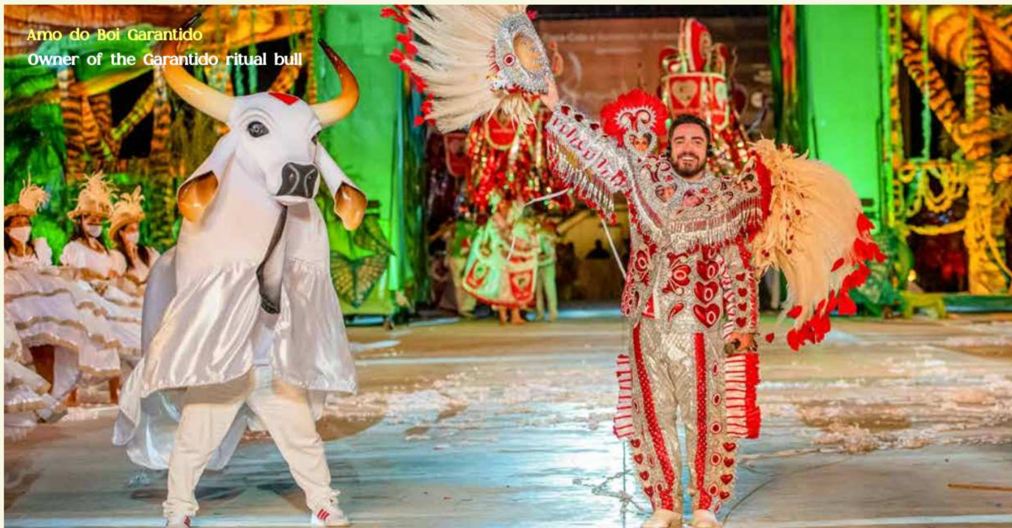
Amo do Boi Garantido Owner of the Garantido ritual bull

O evento movimenta mais de R$ 32 MILHÕES e atrai mais de 50 MIL turistas por temporada.