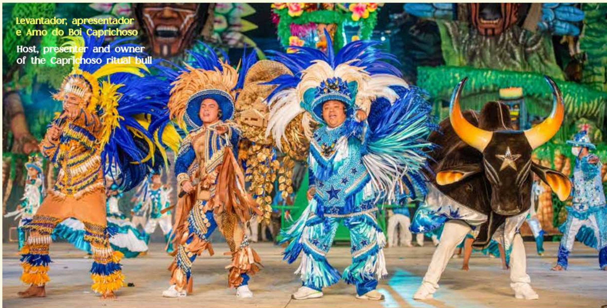
Levantador, apresentador e Amo do Boi Caprichoso Host, presenter and owner of the Caprichoso ritual bull