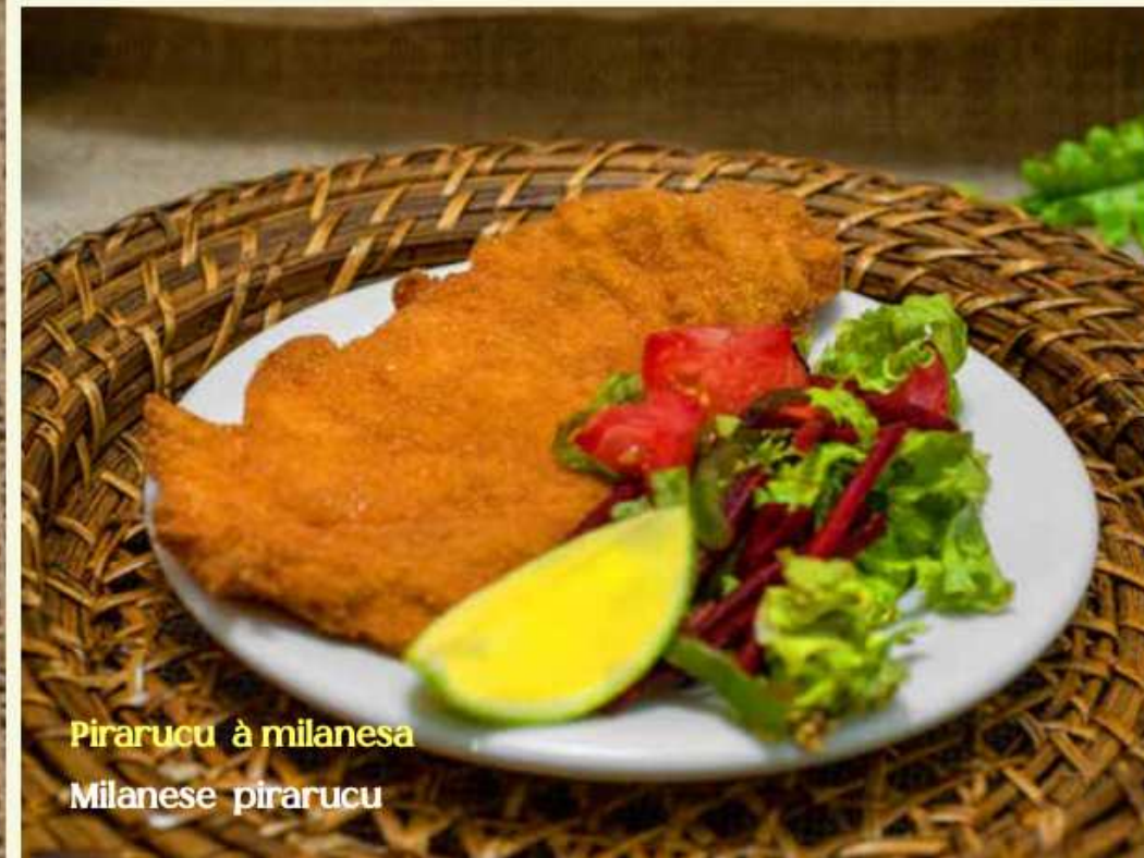
Pirarucu à milanesa Milanese pirarucu

Com fortes influências indígenas, a gastronomia regional transporta os turistas para degustação de sabores inusitados. Com mais de 3 mil espécies catalogadas em seus rios, o peixe é o ingrediente principal da gastronomia no Amazonas e há uma diversidade de maneiras de