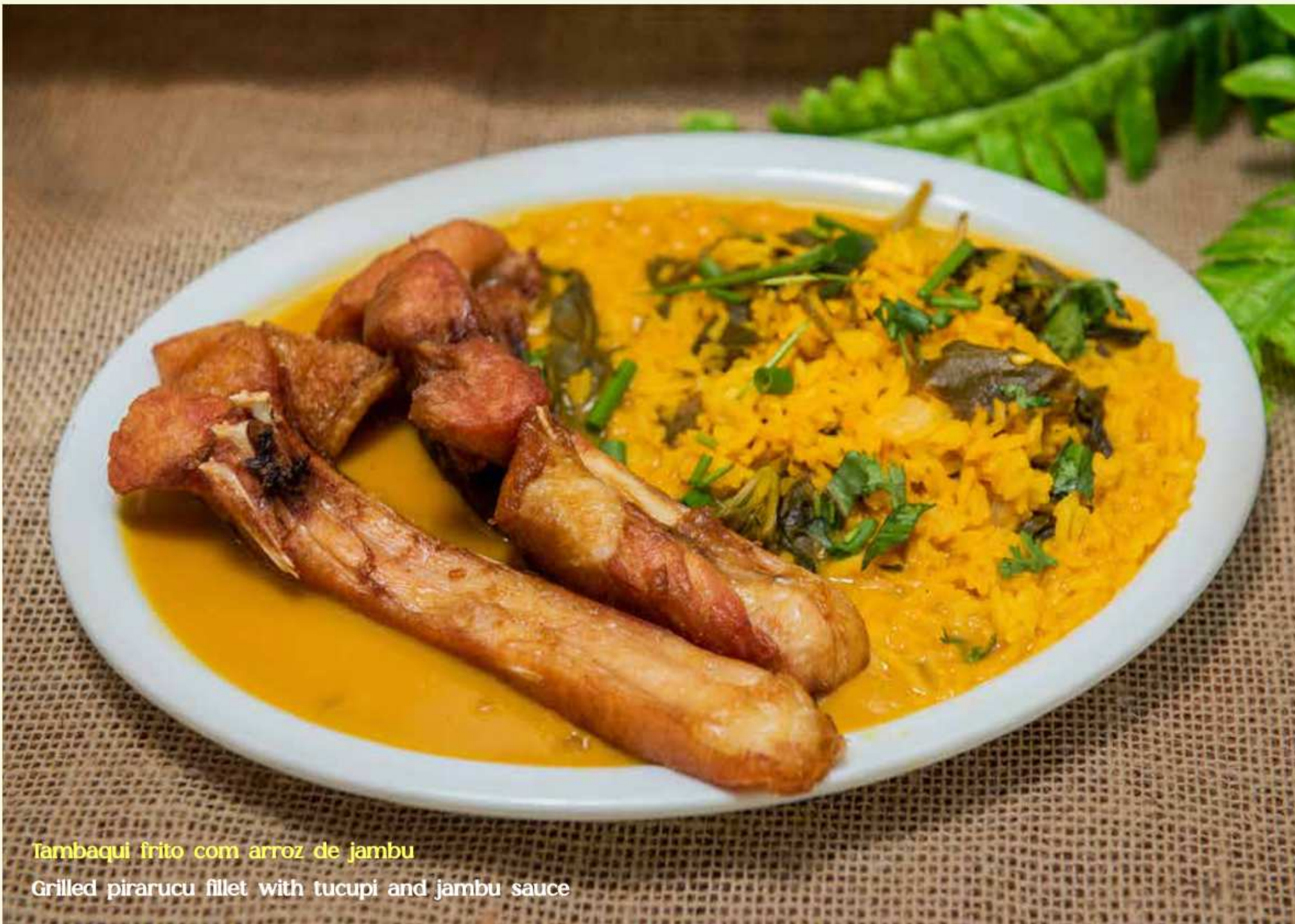
Tambaqui frito com arroz de jambu Grilled pirarucu fillet with tucupi and jambu sauce