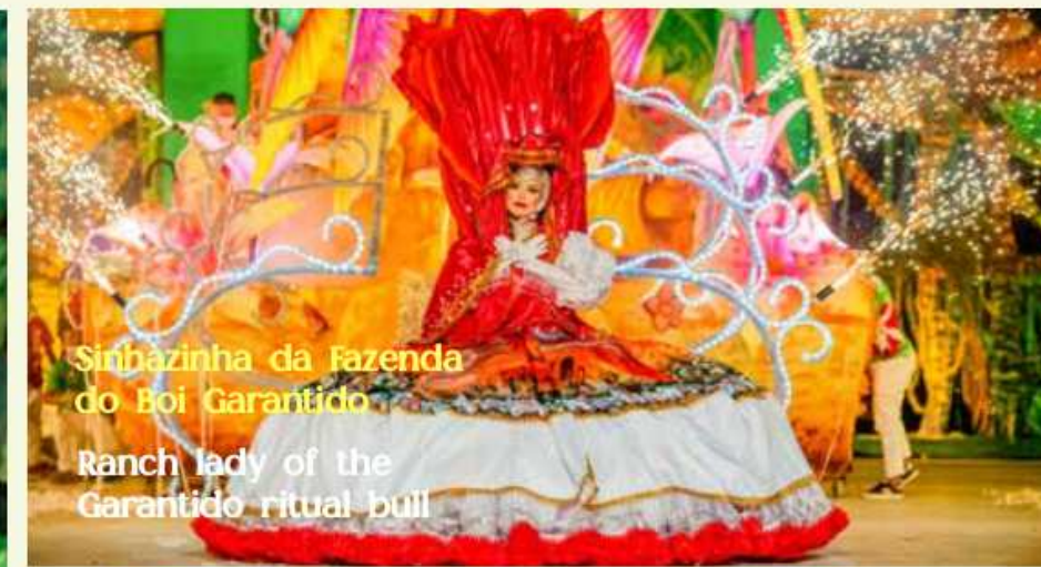
Sinhazinha da fazenda do Boi Garantido Ranch lady of the Garantido ritual bull