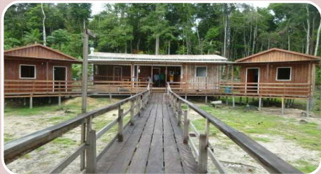
Pedras do Uatumã