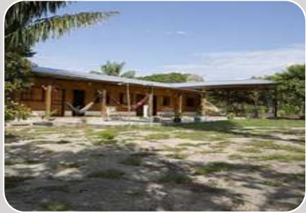
Mirante do Uatumã