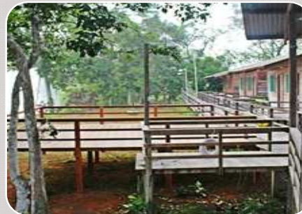
Uatumã Eco Fishing